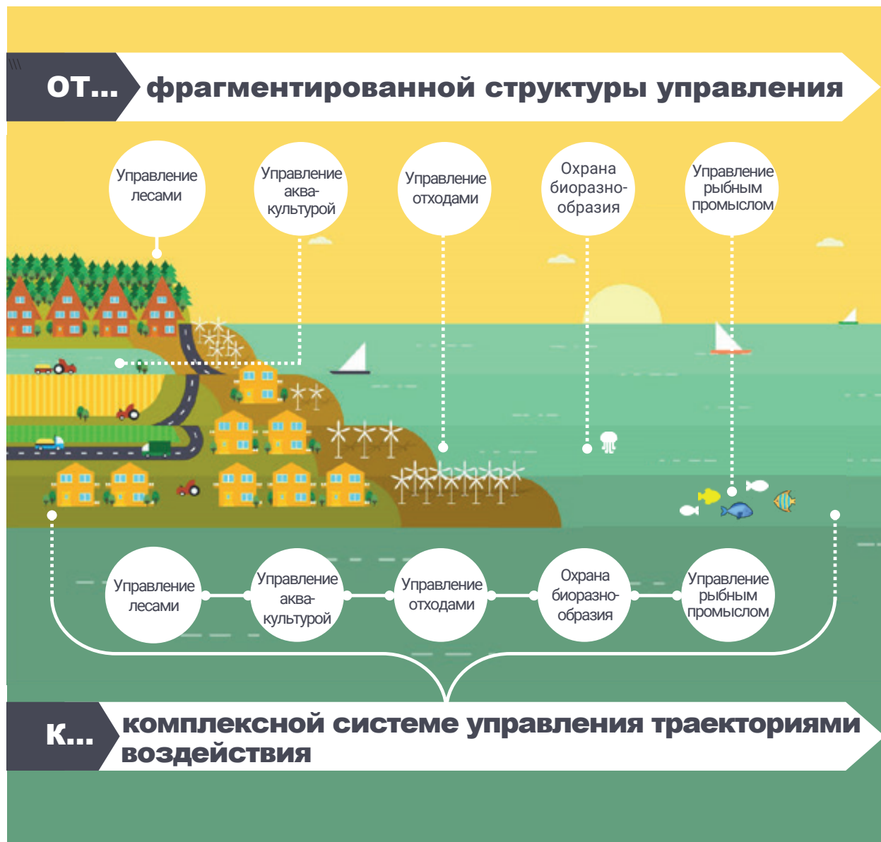
Рисунок 6. Внедрение комплексной системы управления прибрежными районами в целях уменьшения воздействия осуществляемой на суше деятельности на состояние прибрежных ресурсов и содействия переходу к устойчивой «голубой» экономике.