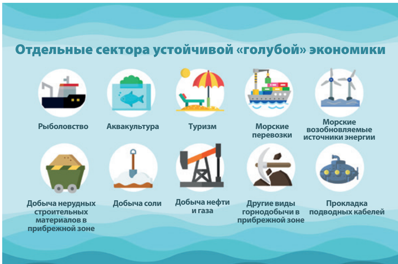
Рисунок 2. Отдельные сектора устойчивой «голубой» экономики