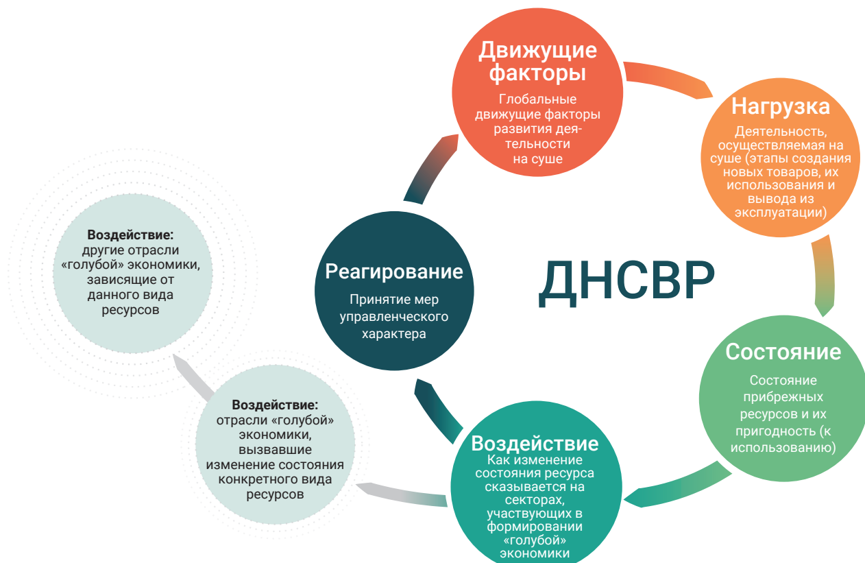
Рисунок 3. Графическое представление системы показателей ДНСВР.