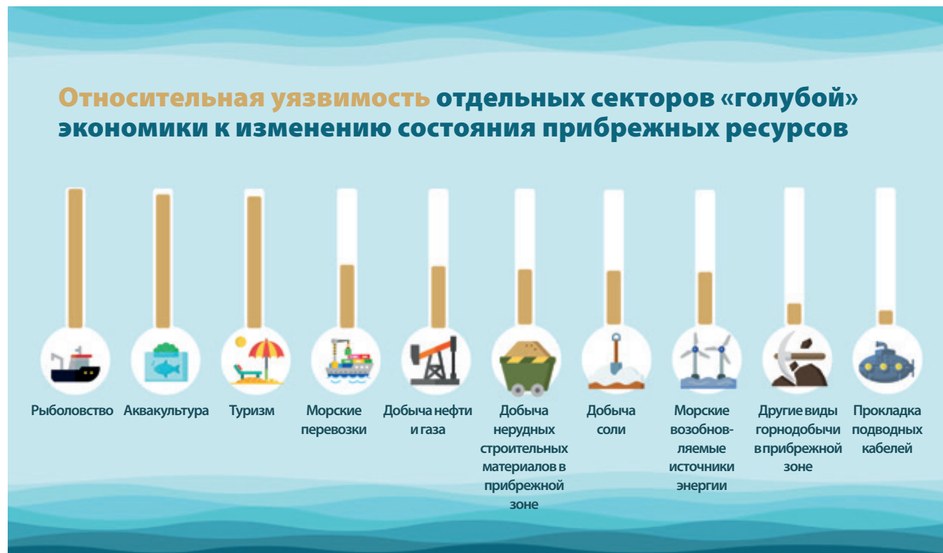
Рисунок 5. Относительная уязвимость отдельных секторов «голубой» экономики к изменению состояния прибрежных ресурсов, связанному с осуществляемой на суше деятельностью.

В национальных и международных стратегиях, касающихся освоения ресурсов Мирового океана, все больший акцент делается на необходимости перехода от неустойчивых моделей использования прибрежных и морских ресурсов к устойчивой «голубой» экономике. В этом отношении большое значение приобретает анализ последствий, которые будет иметь изменение состояния ресурсной базы в прибрежной зоне, вызванное деятельностью на суше, для устойчивого развития «голубой» экономики. Как показано на рисунке 5, все сектора «голубой» экономики являются уязвимыми к изменениям состояния прибрежных ресурсов, обусловленным осуществляемой на суше деятельностью. При этом рыболовство, аквакультура и туризм уязвимы значительно больше в сравнении с другими отраслями, главным образом из-за их зависимости от биотических ресурсов прибрежной зоны, которые в наибольшей степени подвержены риску негативных последствий осуществляемой на суше деятельности. Во вставках 3 и 4 анализируются последствия осуществляемой на суше деятельности соответственно для аквакультуры и деятельности, связанной с разработкой недр.