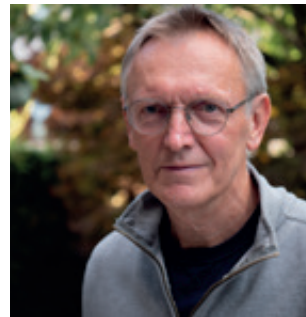
Янез Поточник Сопредседатель Международная группа по ресурсам