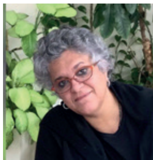
Изабелла Тейшейра Сопредседатель Международная группа по ресурсам

Мы благодарим ведущих авторов и их коллег за самоотверженную коллективную работу, позволившую создать фактологическую основу, которая не оставляет сомнений в необходимости укрепления координации на уровне механизмов управления деятельностью на суше и управления морскими ресурсами. Как подчеркнуто в докладе, существующие границы, нередко отделяющие причины проблем от их последствий, не должны ограничивать эффективность будущих систем управления. Вместе с тем большее внимание должно уделяться обеспечению сохранности наших природных богатств, достижению целей в области устойчивого развития, сформулированных в Повестке дня на период до 2030 года, и отказу от применения подрывающих основы устойчивости моделей использования ресурсов.